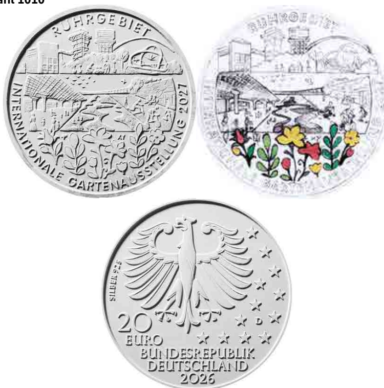
Vorgegebene Wertseite des Künstlers Michael Otto (Rodenbach) aus dem Wettbewerb zur 20-Euro-Sammlermünze „150 Jahre Richard-Wagner-Festspiele Bayreuth“

Der siegreiche Entwurf gliedert sich von oben nach unten in drei Bereiche. Im oberen Bereich sind von links nach rechts die markanten Wahrzeichen Kohlebunker (Norsternpark, Gelsenkirchen), Löschurm (Kokerei Hansa, Dortmund), Wasserturm (Rheinpark, Duisburg) und Wolkenskulptur (Kokereipark, Dortmund) abgebildet, die – überspannt von der Aufschrift RUHRGEBIET – hier repräsentativ für die gesamte Metropolregion stehen. Der mittlere Bereich kann symbolisch für das Großereignis IGA 2027 gelesen werden und zeigt links den Eingangsbebereich in Duisburg, zentral einen Flusslauf mit Altarmen (die renaturierte Emscher), die neue Radbrücke in Lünen sowie in beiden Randbereichen aktive Menschen, die die Gartenausstellung erleben. Im unteren Bereich ist eine farbige Blumenwiese zu sehen. Die an den Münzrand gesetzte Aufschrift INTERNATIONALE GARTENAUSSTELLUNG 2027 rahmt das untere und mittlere Segment harmonisch ein. Die Arbeit besticht durch ihren fein herausgearbeiteten Detailreichtum und ihre gekonnte Komposition von Region, Mensch und Garten. Die Kolorierung unterstützt das Motiv in geeigneter Weise und fokussiert auf den Anlass.